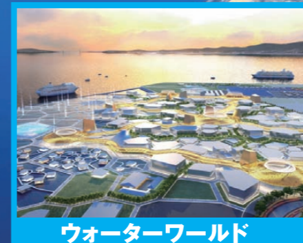
ウォーターワールド

府営住宅の火災保険加入、日本万国博覧会公園事業、フェニックス事業の進捗状況、持続可能な介護保険制度、自転車通行空間の整備 等