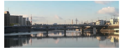
新京阪橋 ～歩道拡幅へ耐震工事を実施～

大阪府と吹田市が連携し検討を進めた結果、浸水対策は千里山から関大前の河川の狭陰区間に対して排水トンネルが整備されることになりました。今年度、詳細設計を実施しており、来年度からは支障物件の移設等が行われます。また阪急豊津駅北側の歩道未整備区間については、河川を暗渠化することにより上部利用を可能とし、歩行空間の確保が図れます。本年度、地質調査や概略設計等が行われています。