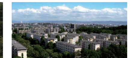
千里ニュータウン ～再生指針2018のまちづくり～

太陽の塔の内部公開や民間事業者による指定管理が始まり、益々賑わいが増加しています。太陽の塔は来年完成から築50年の2020年に国の有形文化財へ登録すべく準備が進められています。また大阪で2回目の万博が開催される2025年に、世界文化遺産への登録が実現するように機運醸成に努めて参ります。同時に、エキスポシティやガンバ大阪等の関係者とも一層連携を密にして、快適で魅力あるナショナルパークを目指していきます。併せて、地元吹田の皆さんにご理解頂ける周辺環境の整備も鋭意進めていきます。