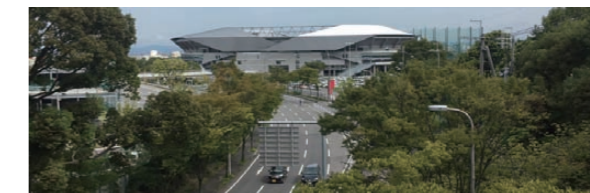
万博記念公園 ～太陽の塔を世界文化遺産へ～

慢性的な渋滞が発生しているJR岸辺駅北側から大京線合流部までの区間において、北行きの2車線化(右左折レーン)及び歩道整備が完成しました。本年度は、南行きの歩道整備及び残された用地買収を進めてまいります。また次期の道路整備計画に、阪急京東線部分の高架化が盛り込まれるように鋭意働きかけて参ります。