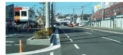
府道豊中岸部線(岸部中工区) ～南行きの歩道整備を実施～

狭陰な歩道の拡幅に向け、昨年度は橋の耐震工事が行われましました。当初は、本年度に残りの耐震工事及び下流側の歩道拡幅が実施される予定でしたが、地震等の災害復旧工事等の影響で入札が不調となり、残りの耐震工事のみが実施されることとなりました。来年度には確実に下流側の歩道拡幅が行われるように働きかけて参ります。現在約1.5mの歩道が、約4mに拡幅される予定です。また街灯等も新設される予定です。