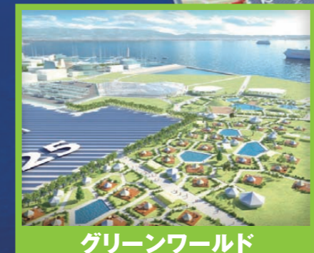
グリーンワールド