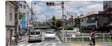
上の川 浸水対策&まちづくり ～排水トンネル及び歩道整備～

現在、阪急京東線高架部分の工事が鋭意進められています。本年度は、東側の下部工(橋脚)が整備され、関連する水道や下水道等の工事も進められています。来年度からは、仮設の歩道橋や高架部分の上部工の製作にも着手されます。また、西側の末広工区の歩道整備も全線供用までに確実に実施されるように働きかけて参ります。