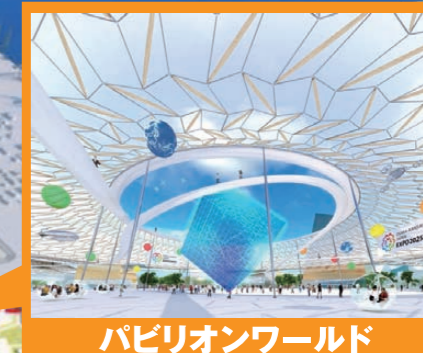
パビリオンワールド